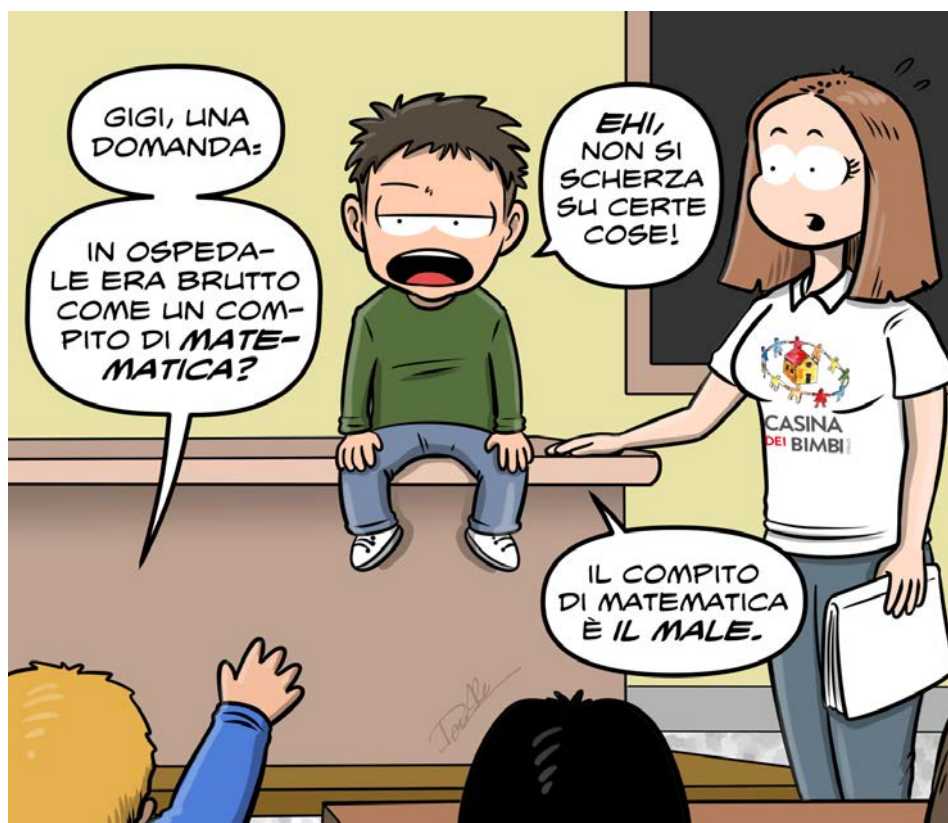
Vignetta di Don Alemanno per Casina dei Bimbi

Diamo visibilità alla diverse sfumature della malattia, sosteniamo bambini e giovani ammalati una volta rientrati a scuola, limitando i rischi di un abbandono scolastico nel primo biennio delle scuole superiori.